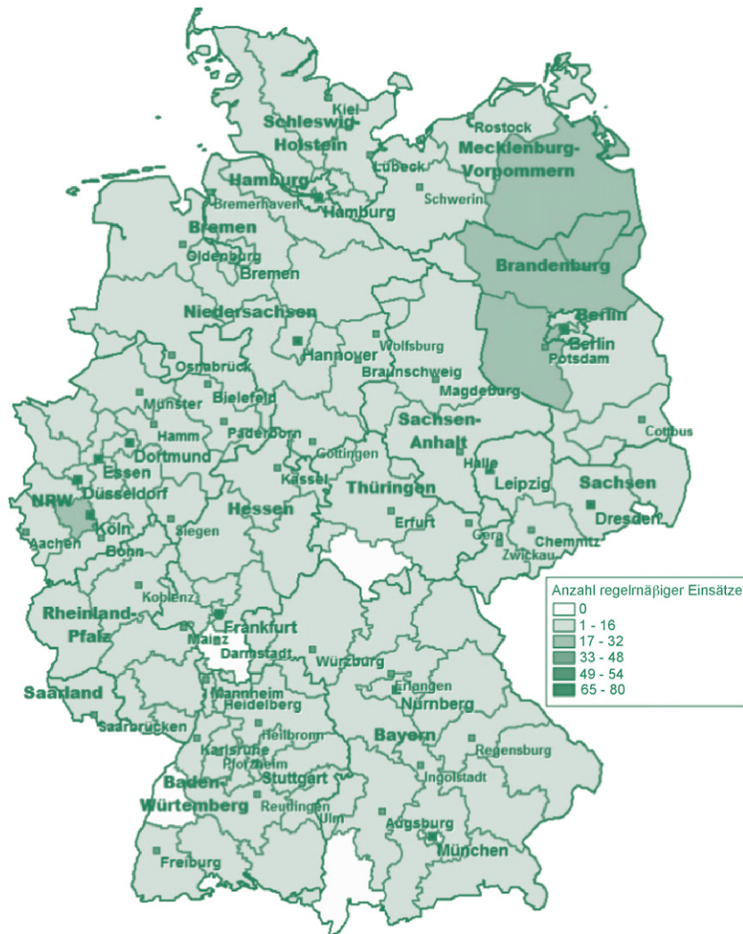
Abb. 3 Anzahl Auftragsorte nach PLZ Regionen.

Die Akquise von Arbeitsaufträgen auf Honorarbasis erfolgt häufig über Vermittlungsagenturen. Nur ein Viertel der Studienteilnehmer gab an, nicht mit Vermittlungsagenturen zusammenzuarbeiten. Als zweit häufigste Methode neue Auftraggeber zu finden, wurden private Kontakte genannt.